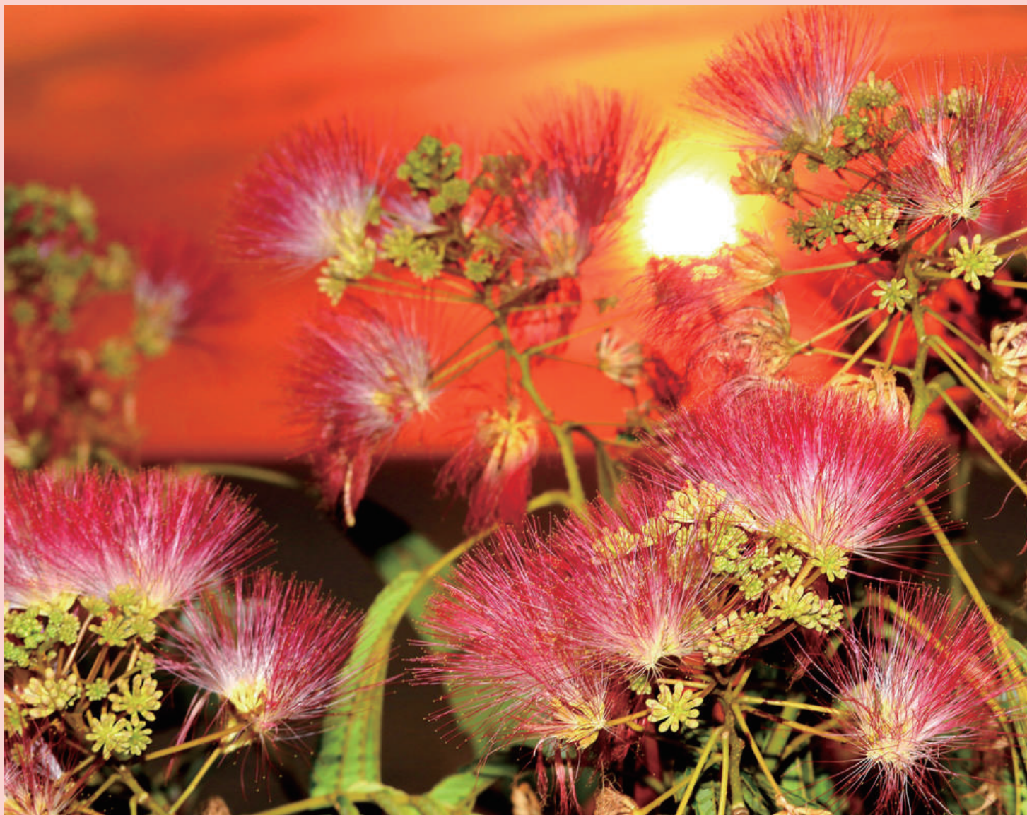
ハマネムノキと夕日